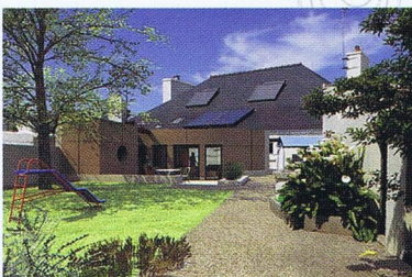
Maison à Riantec

Notre démarche se fonde sur une conception bioclimatique dès l'esquisse du projet.