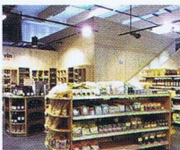
Biocoop de Lanester