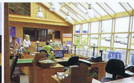
Biocoop de Mellac