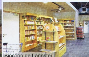
Biocoop de Lanester