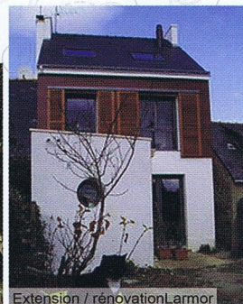
Extension / rénovation Larmor