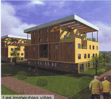
Les immeubles villas