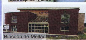
Biocoop de Mellac