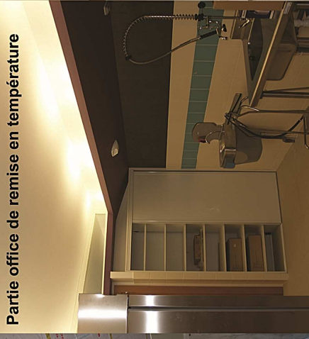
Partie office de remise en température