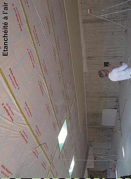
Étanchéité à l'air