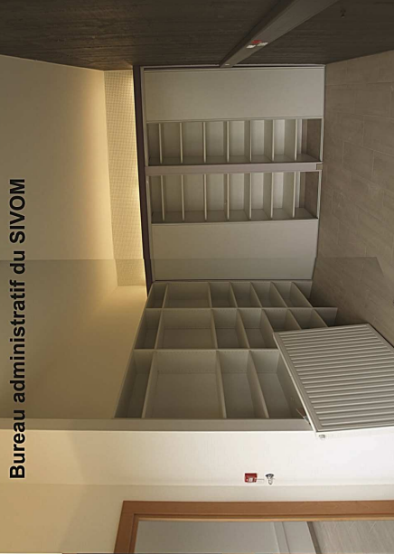
Bureau administratif du SIVOM