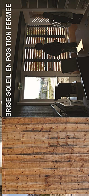
BRISE SOLEIL EN POSITION FERMÉE