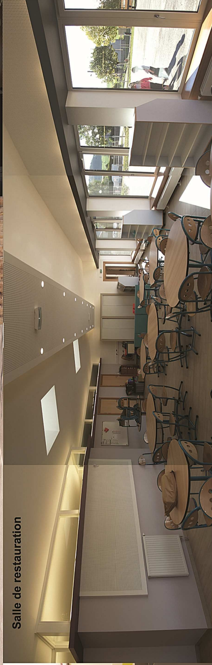
Salle de restauration