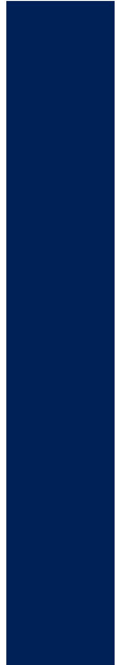
Réhabilitation complète d'un studio de 23m 2 , Paris VIIe