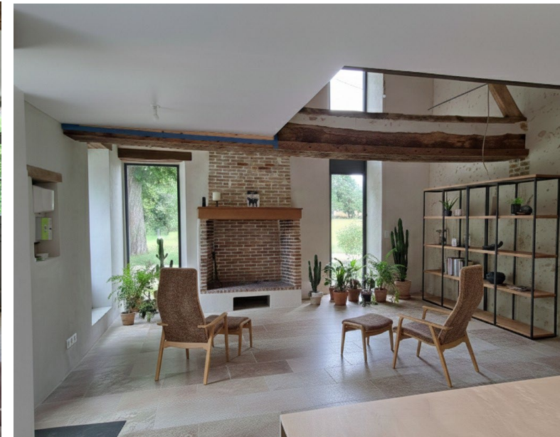
Réhabilitation complète et extension d'une longère de 150m 2 , Autheuil