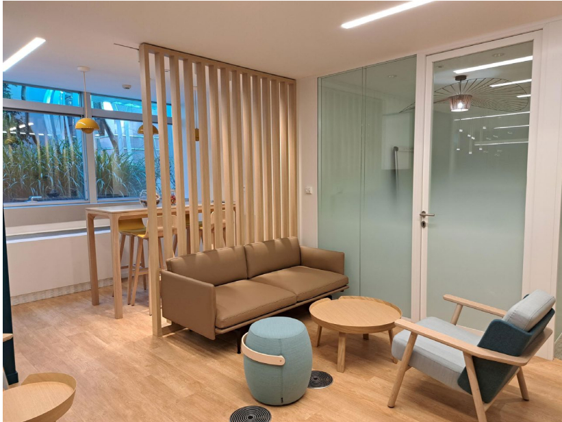
Immeuble Etoile St Honoré, 21-25, rue Balzac, Paris 8, paliers ascenseurs et bureaux