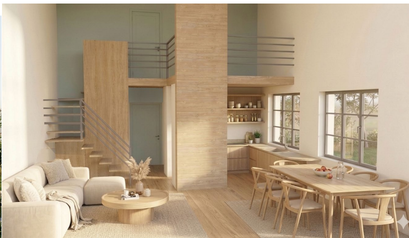
Projet de maison écologique en bois de 150m 2 , Saint Martin d'Ecublei