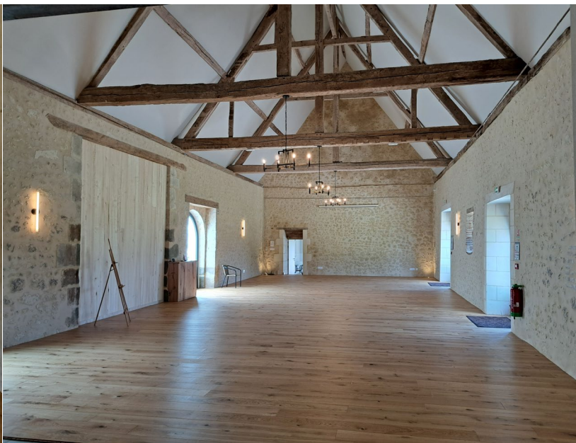
Réhabilitation complète d'une grange pour transformation en une salle de réception de 200m 2 , La Revardières, Feings