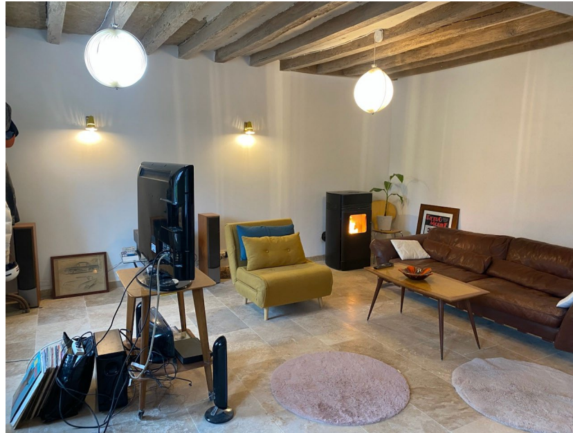
Réhabilitation complète et rénovation énergétique d'une maison de ville de 180m 2 , Bellavilliers