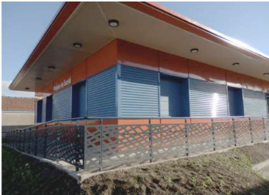
Aménagement d'une maison de santé

Lieu : Chartres (28000) ; MO : Ets Futurol Fabrication de volets roulants Surface : 8 320 m 2 ; Prix : 4 183 466 €HT ; Délais : 12 mois