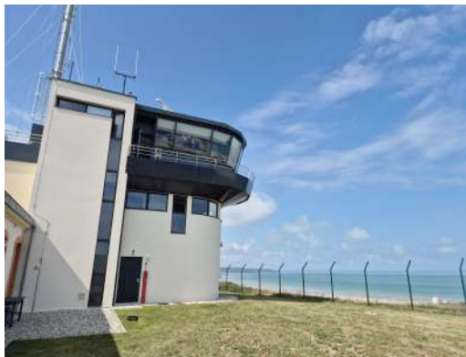
Extension et rénovation du Sémaphore

Lieu : Croth (27530) ; MO : Commune de Croth Surface : 1 582 m 2 ; Prix : 2 160 668 €HT ; Délais : 36 mois