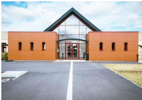
Construction d'une cantine et d'une salle d'activités

Lieu : Dieppe (76200) ; MO : Etablissement de Service et d'Infrastructure de la défense de Renne Surface : 380 m 2 ; Prix : 1 880 000 €HT ; Délais : 18 mois