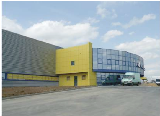
Création d'un bâtiment industriel

Lieu : Saint Georges Motel (27710) ; MO : Commune de Saint George Motel Surface : 241 m 2 ; Prix : 268 000 €HT ; Délais : 12 mois