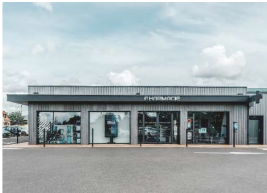
Pharmacie et cabinet médical avec 3 logements

Lieu : La Couture-Boussey (27750) ; MO : Commune de la couture-Boussey Surface : 280 m 2 ; Prix : 462 000 €HT ; Délais : 12 mois