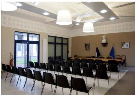
Réaménagement de la mairie et extension

Lieu : Bailleau-le-pin (28120) ; MO : Comcom entre Beauce&Perche Surface : 250 m 2 ; Prix : 625 000 €HT ; Délais : 12 mois