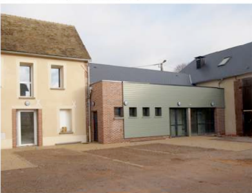
Aménagement d'une maison d'association et salle de sport

Lieu : Marcilly sur eure (27810) ; MO : Commune de Marcilly sur eure Surface : 406 m 2 ; Prix : 636 530€HT ; Délais : 12 mois