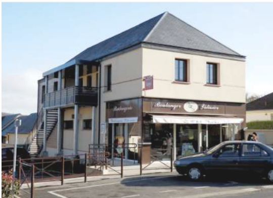
Aménagement d'une boulangerie

Lieu : Bois-le-roi (27220) ; MO : Commune de Bois le roi Surface : 112,20 m 2 ; Prix : 264 360 €HT ; Délais : 4 mois