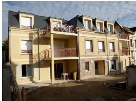
Construction d'un ensemble de 8 logements

Lieu : La chaussée d'Ivry (28260) ; MO : Mairie de la Chaussée d'Ivry Surface : 645,45 m 2 ; Prix : 745 677 €HT ; Délais : 12 mois