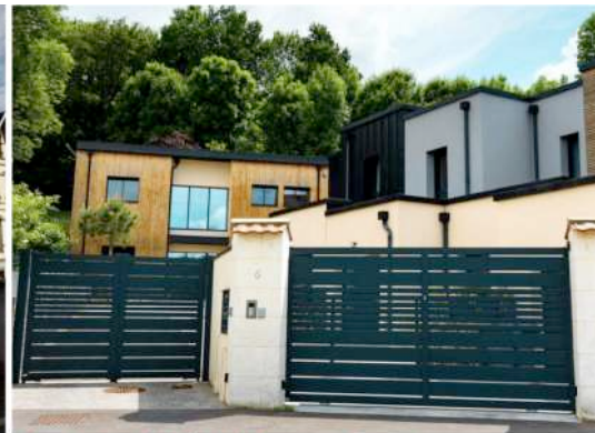
Construction d'1 villa et de 3 maisons groupées

Lieu : Ivry-la bataille (27540) ; MO : SCCV Margot Surface : 546 m 2 ; Prix : 2 065 000 €HT ; Délais : 18 mois