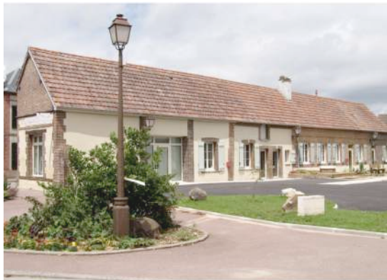
Aménagement d'un cabinet infirmière et salon de coiffure

Lieu : Bois-le-roi (27220) ; MO : Commune de Bois le roi Surface : 112,20 m 2 ; Prix : 264 360 €HT ; Délais : 4 mois