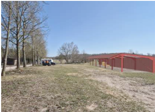
Hangar agricole pour stockage foin Haras de Bonneville

Lieu : Saint George sur eure (28190) ; MO : SCI SMSGSE Surface : 928 m 2 ; Prix : 1 840 000 €HT ; Délais : 18 mois