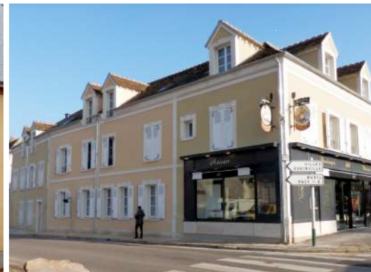
Aménagement de 6 logements et d'un commerce

Lieu : Croth (27530) ; MO : Secomile 27 000 EVREUX Surface : 804 m 2 ; Prix : 1 100 000€ ; Délais : 14 mois