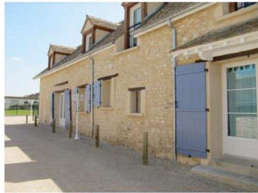
Aménagement de 3 logements sociaux

Lieu : Chartres (28000) ; MO : SAS CASA CONSTRUCTEUR Surface : 551 m 2 ; Prix : 1 300 000 €HT ; Délais : 16 mois