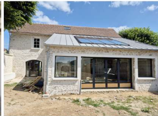
Rénovation et extension d'une maison individuelle

Lieu : Guainville (28260) ; MO : Commune de Guainville Surface : 225 m 2 ; Prix : 338 490 €HT ; Délais : 12 mois