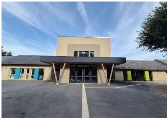
Rénovation et extensions d'une école maternelle et primaire

Écoles / Centres de loisirs / Médiathèques / Mairies / Équipements sportifs