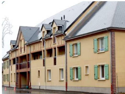
Création de 11 logements sociaux

Lieu : Croth (27530) ; MO : Secomile 27 000 EVREUX Surface : 804 m 2 ; Prix : 1 100 000€ ; Délais : 14 mois