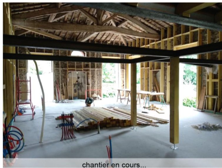
chantier en cours...